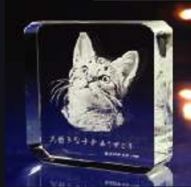
Regular Paperweight レギュラー・ペーパーウェイト