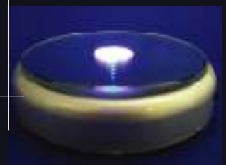
LED Light Base Rotary Type